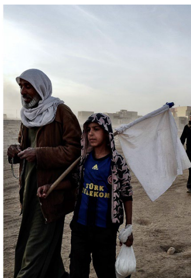
un ensemble (morceaux choisis), Anna Massoni, Le Siège de Mossoul Une épopée contemporaine, Félix Jousserand © Emma Weber et Anna Massoni / 33ème parallèle - © Patrick Chauvel